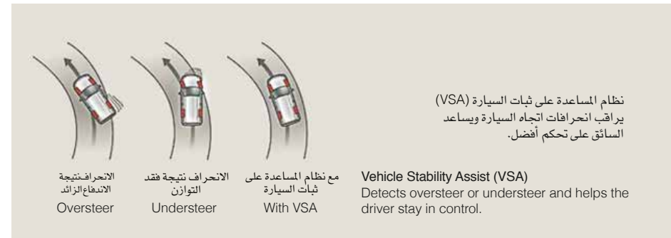
نظام المساعدة على ثبات السيارة (VSA) يراقب انحرافات اتجاه السيارة ويساعد السائق على تحكم أفضل.

وسائد هواء أمامية وأمامية جانبية وستائر هواء جانبية تساعد على تقليل الإصابات في حال وقوع اصطدام. SRS airbag systems Front, front side and side curtain airbags help reduce injuries in collisions.