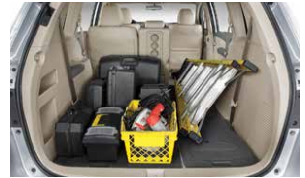
تخزين الحاجيات وترتيب المقاعد بأوضاع مختلفة ومريحة.

Convenient storage and seating combinations.