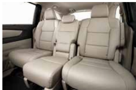
مقعد وسطي منزلق (متحرك) يجعل الطفل في متناول من يجلس في المقعد الأمامي.

Center console Ample storage plus four beverage holders.