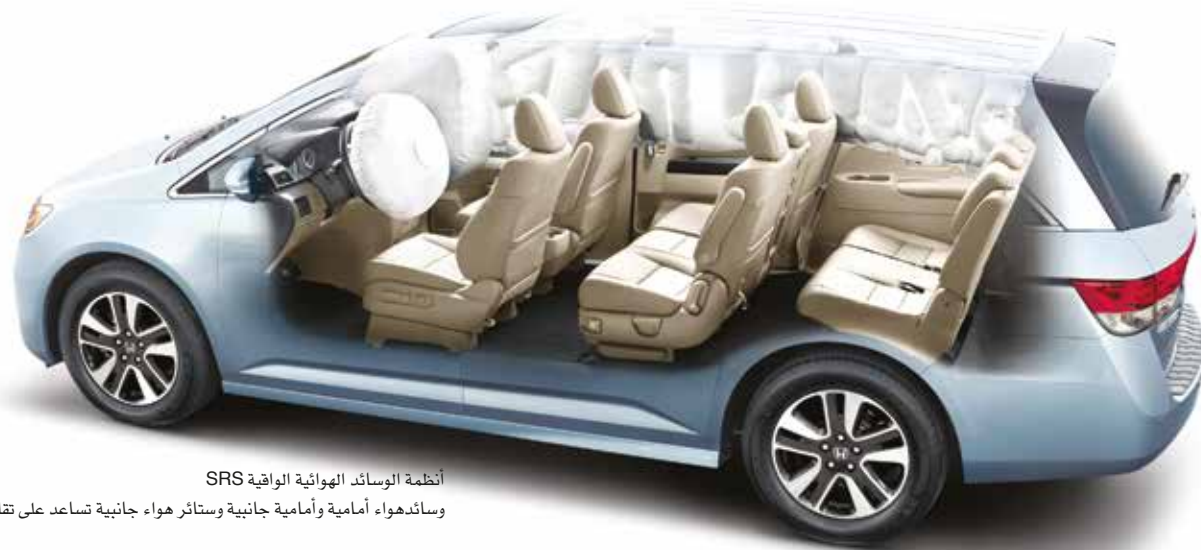
أنظمة الوسائد الهوائية الواقية SRS

وسائد هواء أمامية وأمامية جانبية وستائر هواء جانبية تساعد على تقليل الإصابات في حال وقوع اصطدام. SRS airbag systems Front, front side and side curtain airbags help reduce injuries in collisions.