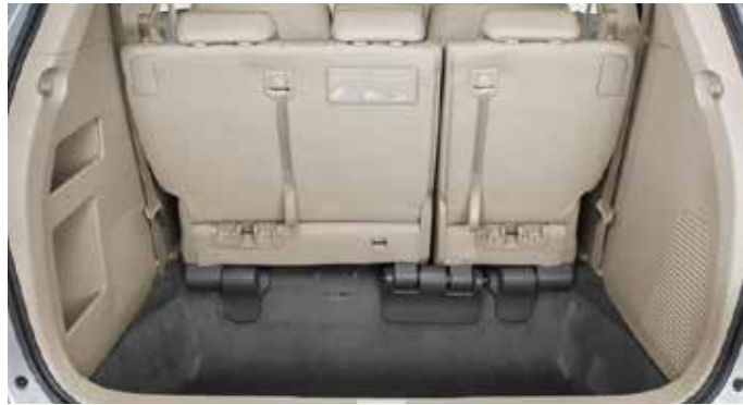
كونسول أوسط يضم متسماً كبيراً للتخزين + 4 حاملات قوارير شراب.

Stowaway rear seats Rear seats lower with one easy motion.