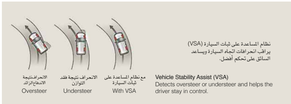
نظام المساعدة على ثبات السيارة (VSA) يراقب انحرافات اتجاه السيارة ويساعد السائق على تحكم أفضل.

وسائد هواء أمامية وأمامية جانبية وستائر هواء جانبية تساعد على تقليل الإصابات في حال وقوع اصطدام. SRS airbag systems Front, front side and side curtain airbags help reduce injuries in collisions.