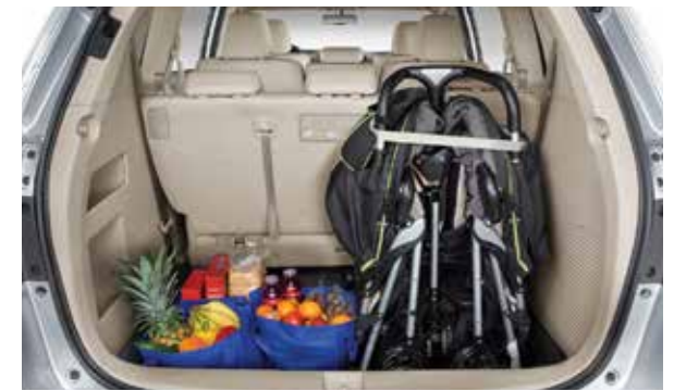
مساحة رحبة للتخزين الخلفي العميق يسهل لاستيعاب عربة أطفال.

Convenient storage and seating combinations.