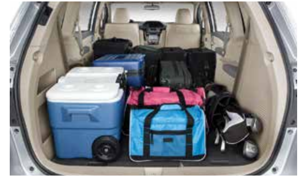
سعة كبيرة للتخزين.